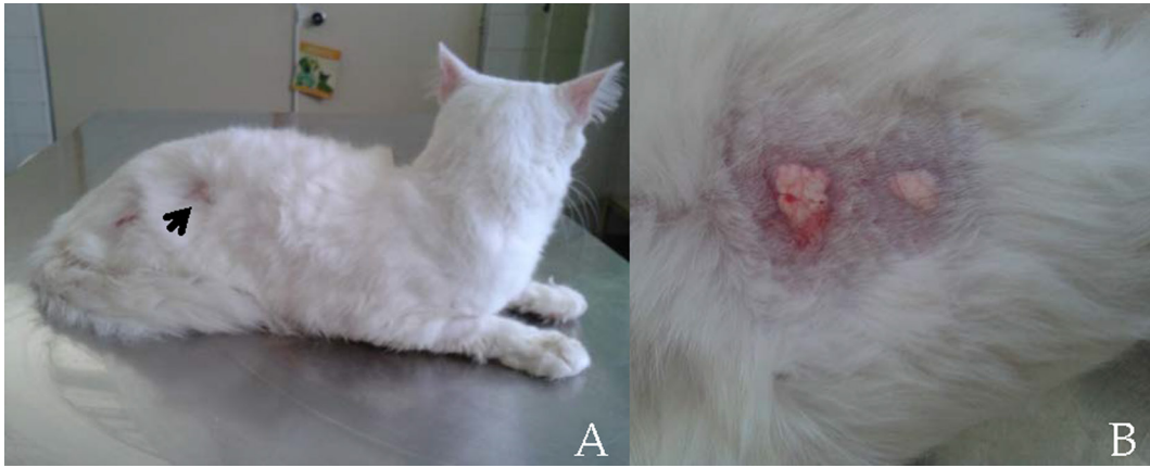
Figura 1. Felino Pelo Curto Brasileiro diagnosticado com calcinose circunscrita apresentando lesões (→) em placa na região do flanco (A); Aumento maior da seta em A (B).